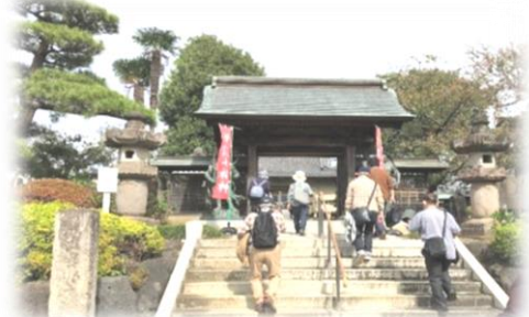
<所沢の歴史グループ> 市内を巡り、所沢の魅力を再発見！