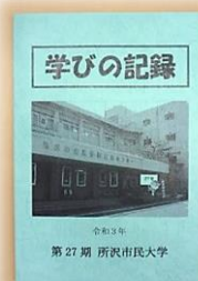
これまでの学習をまとめた冊子 受講生で作ります

大変なこともありますが、 発表会や学びの記録が完成した ときの達成感はひとしおです！