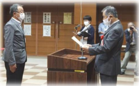
受講生の代表が修了証書を授与