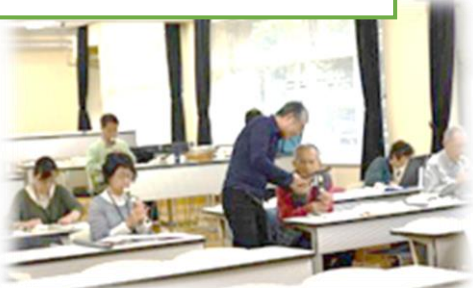
<音楽グループ> 講師のアドバイスを受けながら学習を深めます