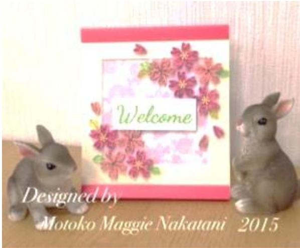
(写真はイメージです。ウサギはつきません)

くるくる渦巻き模様の紙のモチーフを貼り合わせて、今回は、素敵な桜の花の写真立てを作ります。是非、この機会に体験してみてください！