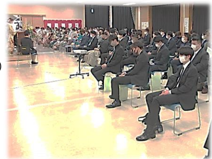
▲昨年度の式典の様子

※市HPで成人のつどいに関する最新情報が閲覧できるようになっておりますので、そちらも併せてご覧ください。