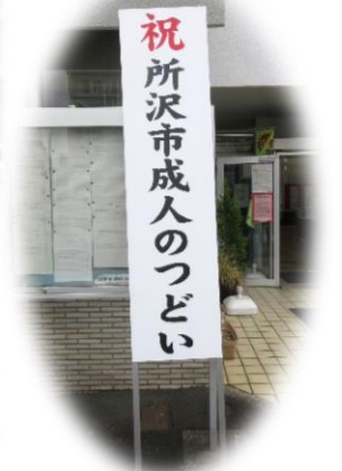
▲何十年(?)ぶりに新調された看板