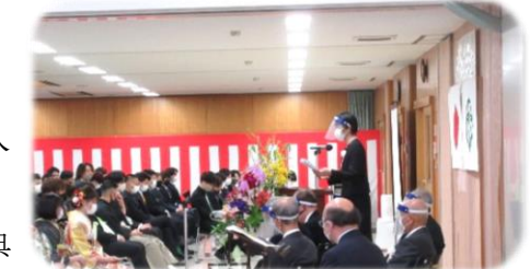
▲式典の様子(市代表のあいさつ)