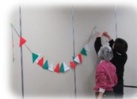
▲催しにあわせた飾りつけ