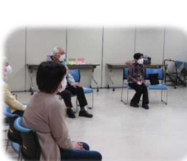
▲参加者と一緒にお話しや健康体操などします