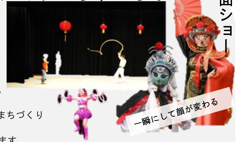
変面ショー 一瞬にして顔が変わる

※ご入場の際しまして整理券が必要となります。 入場料は当日受付にてお支払いいただきます。 ※平成30年2月15日（木）午前9時より柳瀬まちづくりセンター窓口にて整理券を配布いたします。 ※整理券はお一人様4枚までとさせていただきます。 ※配布予定枚数がなくなり次第、配布終了となります。 ※駐車台数に限りがございますので、できるだけ公共交通機関等をご利用ください。