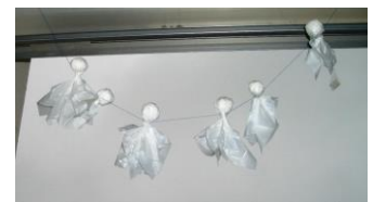
てるてる坊主を作りました

ところが当日は朝からあいにくの空模様。10時の開始時刻前には、参加者の皆さんも傘をさしての集合で、一時はどうなることかと思いましたが、食の最大間近となった11時頃、薄い雲を通して、話のとおり欠けた太陽を観察することができました。ほんの10分足らずの天文ショーながら