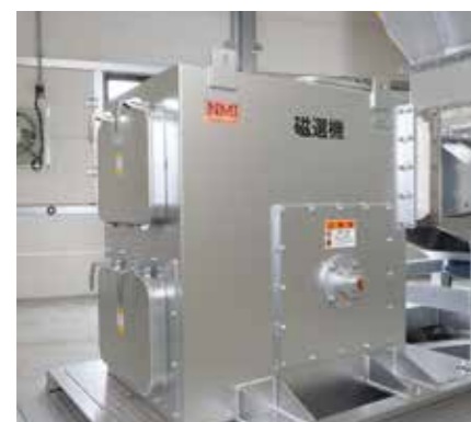
磁選機 焼却炉から取り出された不燃物から、さらに鉄分を選別するための設備です。