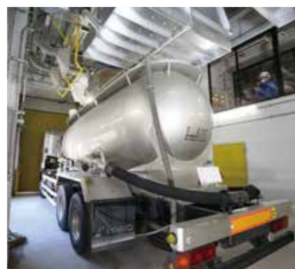
灰積出室 灰バンカに貯留した灰を飛散させることなく車両に積載し搬出することができます。