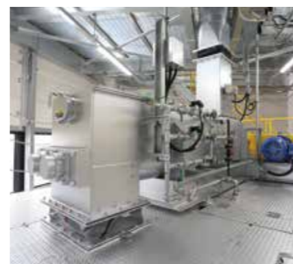
灰混練機 灰に薬剤を加えて混ぜ込むことで重金属類の溶出を防止することができる設備です。