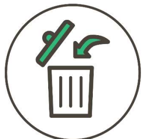
ごみ減量・リサイクル