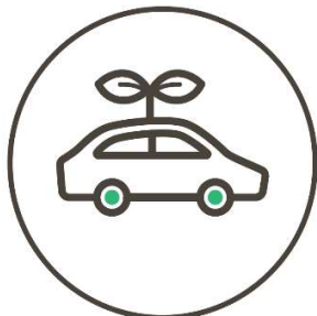
環境にやさしい移動の実施