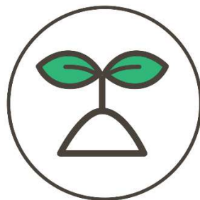
地場産製品・食品等の生産・利用