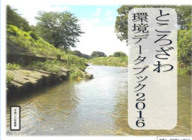
○データブック表紙

当課では、所沢市の大気汚染や河川・地下水などの環境にかかる調査を行い、結果を『環境データブック』として公開しています。