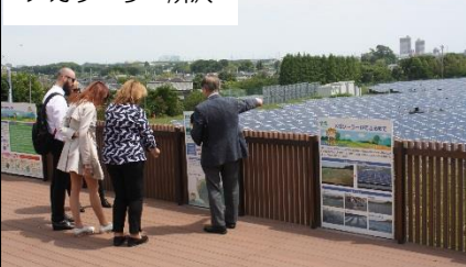
メガソーラー所沢