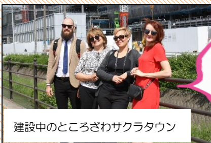
建設中のところざわサクラタウン

国際都市間協力(IUC)プロジェクトの連携都市である、スロバキアの首都ブラチスラバ市より訪問団4名が来訪し、所沢のまちづくりなどを視察しました。