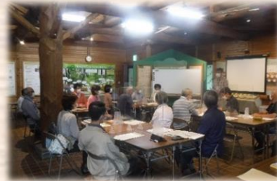
みどりのパートナー育成講座