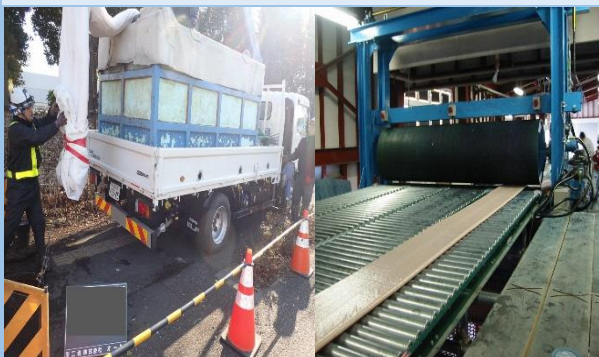
▲(左)現場搬入状況 (右)材料製造状況

老朽化や破損がひどい管を道路を掘らずに、新しい管にする材料の製造を行っています。下水道管の耐久年数は50年です。所沢市には、耐久年数を超えた管が多くあります。そういった管の維持・管理を行っています。