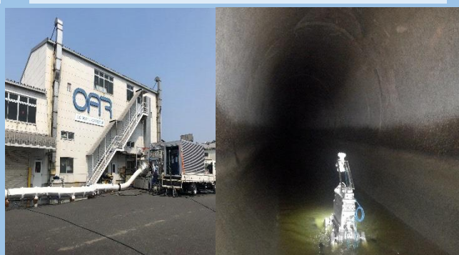
▲(左)材料試験状況 (右)直径4mの管のカメラ調査