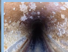
▲下水道管内(工事前)

設立年：1991年 資本金：10,000,000円 従業員：15名 所在地：〒359-1167 所沢市林1-194-4 連絡先：080-2119-9025 E-mail：t.aoki@oar.co.jp