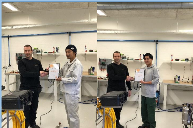
▲デンマークの取引先会社にて研修、研修終了検定授与