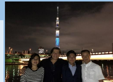
▲(左から)通訳・取引先社長・若手社員・弊社社長