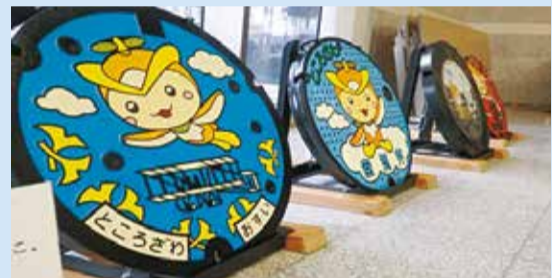
マンホール蓋等を展示

休憩コーナーには、「所沢の水道の歴史」のパネル、マンホール蓋等を展示しています。