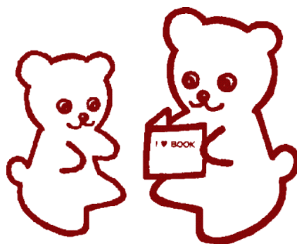
所沢図書館マスコットキャラクター トベア