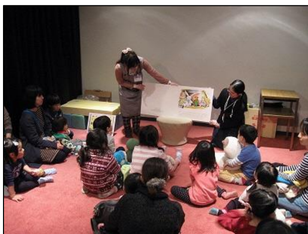
▲図書館まつりおはなし会 「ぬいぐるみと一緒に」

この計画の対象は、0歳から18歳の子どもとその保護者とします。また、子ども読書活動の推進に関わる教育・福祉・保健関係者等も対象に含みます。