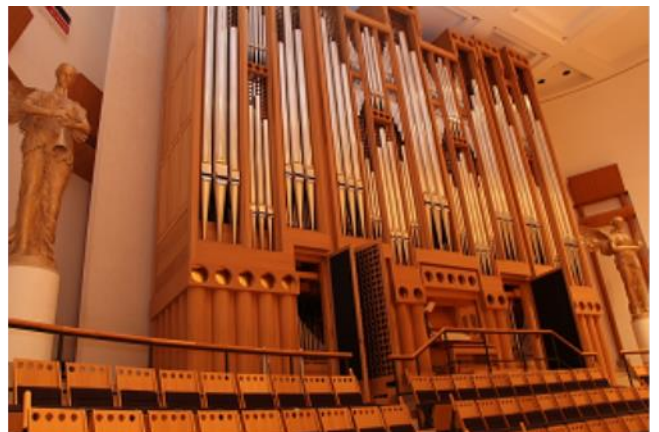
オーバーホールを実施したパイプオルガン