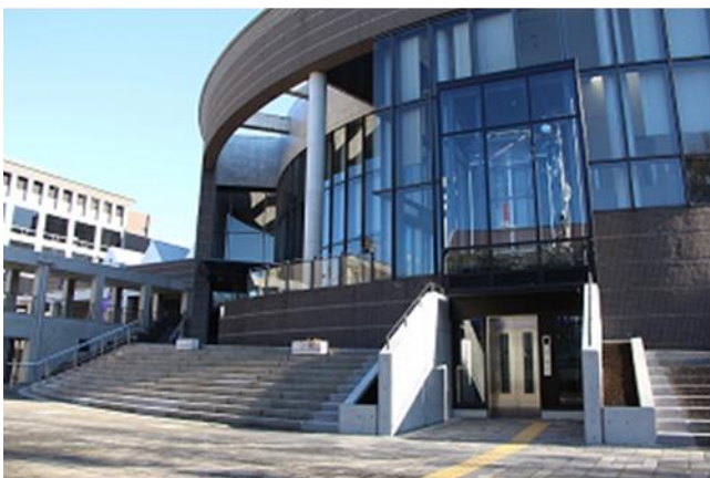
新たに中ホール入口に設置されたエレベーター