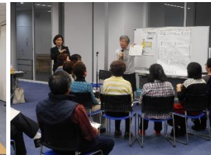
▲要約筆記のポイントとは...