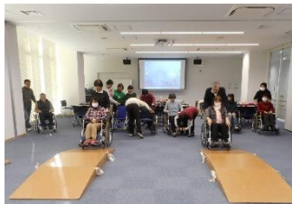
▲車椅子での坂道体験