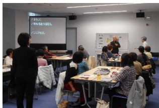
▲和やかな雰囲気での講義

受講をきっかけに、今後街なかで障害をお持ちの方を見かけた際、積極的にサポートをしていただけるのではないのでしょうか。