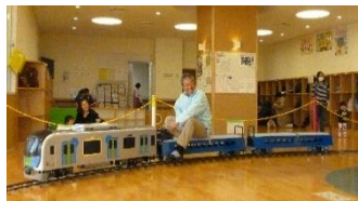
▲大人が乗っても動きます