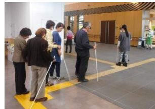
▲点字ブロックを頼りに館内を歩行