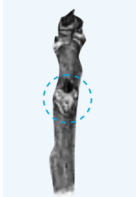
オニグルミの葉痕

北方から寒さを逃れてきた野鳥たちは、雑木林が秋に蓄えた木の実や草の種子等を食べに集まってきています。また、落ち葉の下等で越冬している虫等とはとりわけごちそうです。雑木林は野鳥たちに、食べ物と住まいを提供しています。