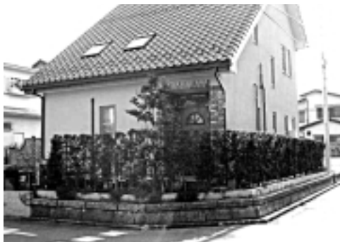
▲生け垣づくり補助制度活用例