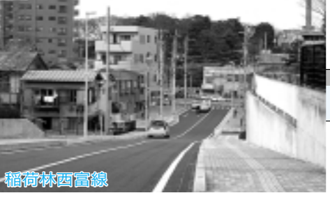
河川・水路の改修・整備

都市計画道路の建設につきましては、上新井富岡線の所沢北高校・県道川越所沢線区間、北野下富岡線の県道川越所沢線区間、3・5号線区間が本年度末には開通します。また、所沢村山線の所沢駅西口交差点・稲荷林西富岡交差点区間は、北原安松線の東川を横断する橋台工事とあわせ用地買収を進めていきます。航空管制部前交差点改良は、本年度の早期に完了します。県道所沢所沢線の県道所沢青柳線・県道所沢武蔵村山立川線区間、県道所沢所沢狭山線区間の3・3号線(下富岡)・県道川越所沢線区間は、県と連携しながら一層の促進を図るべく努力をしていきます。その他の道路では、交差点改良および拡幅・舗装整備を積極的に進め、幅員の狭い生活道路の拡幅整備をしていきます。さらに所沢駅東口広場は、駅前のイメージアップを図るため、照明灯を設置していきます。都市計画につきましては、まちづくり条例の制定に向け引き続き作業を進めていきます。元町北地区では、引き続き都市基盤整備公園とともに早期の事業者手に向け努力していきます。日東地区では、引き続き都市計画決定に向けて事業の促進を図るべく支援していきます。優良建築物等整備事業による民間の再開発は、寿町西地区、寿町南地区の事業の進展に向けて支援・指導していきます。土地区画整理事業につきましては、早