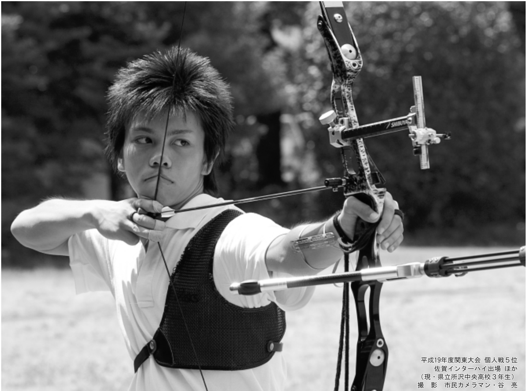
平成19年度関東大会 個人戦5位 佐賀インターハイ出場 ほか (現・県立所沢中央高校3年生)