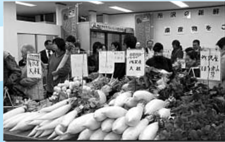
▲装いも新たに農産物直売所「とことこ市」がオープン（移転）。所沢産の新鮮な野菜を買い求めるため、たくさんのお客様が来店しました。 1月10日(木)／農産物直売所「とことこ市」(御幸町2-14)