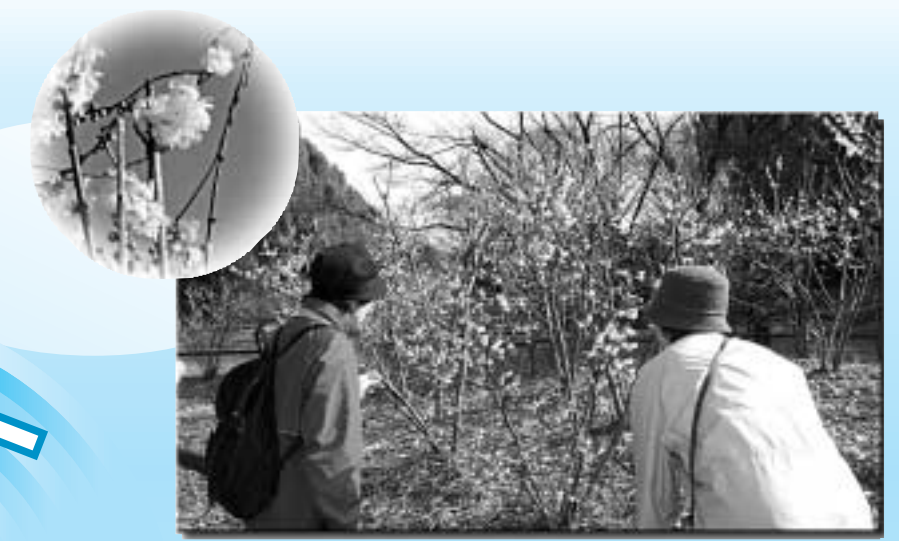
▲花の少ないこの時季に、青空に映えるロウバイが美しく咲き始め、辺り一面に甘い香りを漂わせています。2月の中旬ごろまでが見ごろです。 1月10日(木)／航空記念公園内彩翔亭東側のロウバイ園