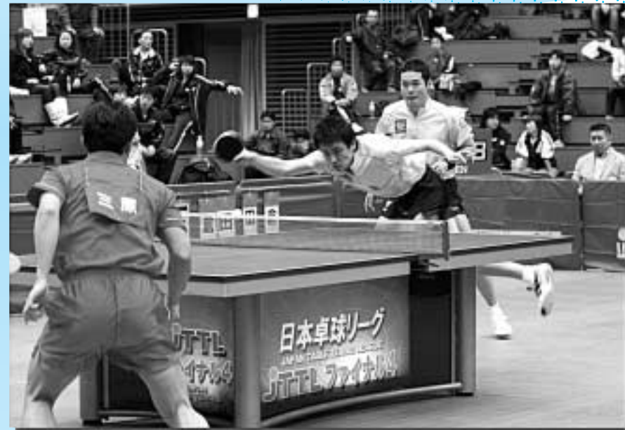
▲日本のトップ選手が勢ぞろい。外国の選手も参加して、白熱した競技が繰り広げられ、会場には大勢の卓球ファンが集まった「日本卓球リーグ」 12月22日(土)・23日(日)／所沢市民体育館