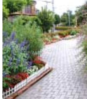
▲市民活動による花づくり

問 都市計画課 ☎2998-9192 FAX2998-9163 Eメール a9192@city.tokorozawa.saitama.jp