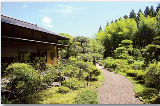
緑に囲まれた「野外ステージ」 日本庭園も楽しめる「彩翔亭」