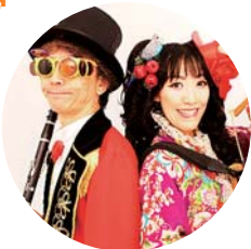
ジンタラムータ (写真：鳥賀陽弘道)