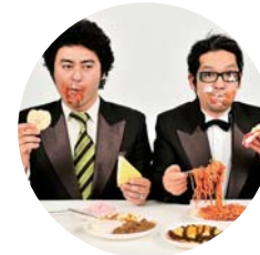
バンバンバザール