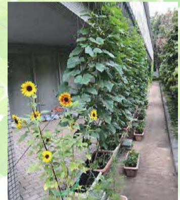
昨年度の入賞写真