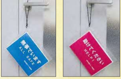
▲災害時安否確認キット

今年開催した、所沢地区自主防災訓練では町内会加入世帯を対象として、キットを活用した安否確認の訓練を実施いたしました。