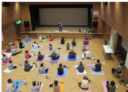
元気になる体操教室