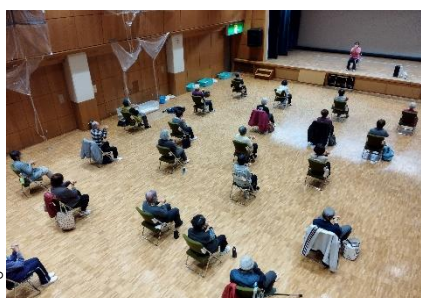
イスに座っての体操ひろば

【持ち物】ストレッチマット or バスタオル、室内履き、水分補給できるもの、汗拭きタオル