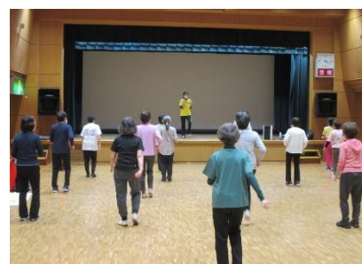
いきいきフレッシュ体操教室