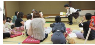
▼所沢図書館富岡分館による 読み聞かせ▼