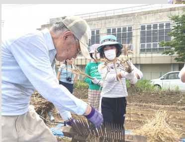
昨年の脱穀の様子