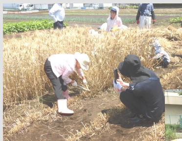
昨年の麦刈りの様子