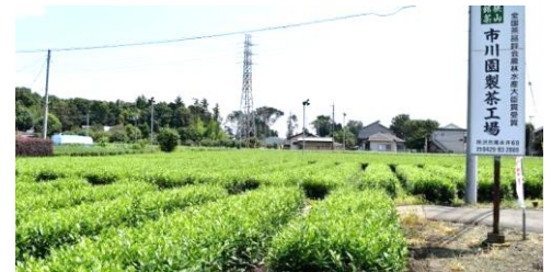
去年の設置場所の一つ 「お茶の市川園(南永井)」です。