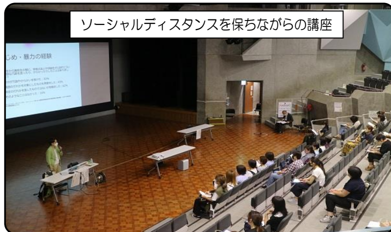
人権教育合同講座の様子(令和4年7月:松井公民館)