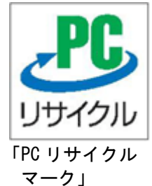
「PC リサイクル マーク」

ただし、市と協定を結ぶ小型家電リサイクル法による認定事業者で回収依頼をする場合は、この限りではない。