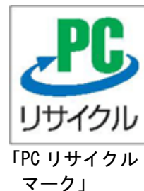
「PC リサイクル マーク」

ただし、市と協定を結ぶ小型家電リサイクル法による認定事業者で回収依頼をする場合は、この限りではない。