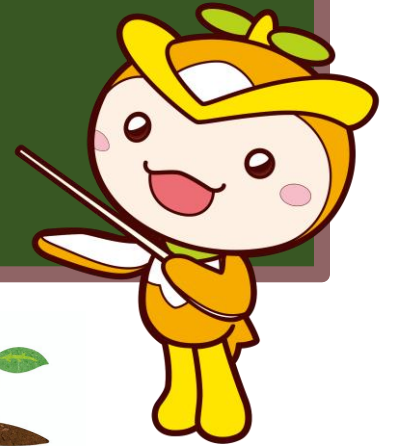
所沢市イメージマスコット トコロん

以上、グランエミオ所沢様をご紹介させていただきました。 市内事業者の皆様も、まずは自社でできそうなことから、 取り組んでいただければ幸いです。 引き続き、事業系ごみ削減へのご協力をお願いいたします。