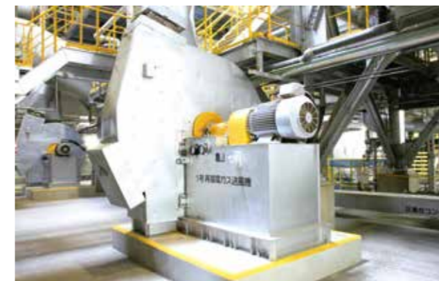
再循環ガス送風機

排ガスに含まれる塩化水素と硫黄酸化物は、湿式洗煙装置内で苛性ソーダと反応させることで取り除きます。