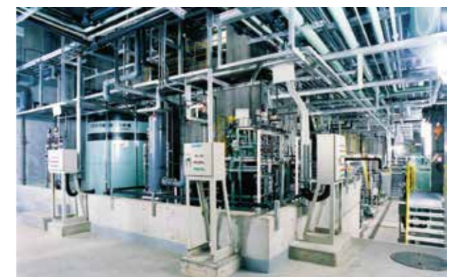
プラント排水処理設備

ろ過集じん器で取り除いた飛灰は、混練機で重金属を安定化させ、場外へ搬出されます。