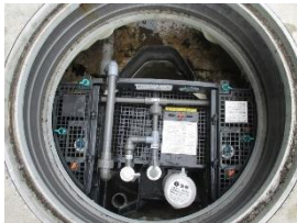
←正常(健康)な浄化槽

○浄化槽の保守点検や清掃は、人でいう日頃の「健康管理」にあたります。一方で法定検査は、「健康診断」にあたります。定期的に検査を受け、浄化槽に異常がないか確認しましょう。