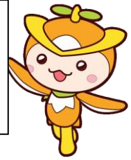
所沢市のイメージマスコット トコロん