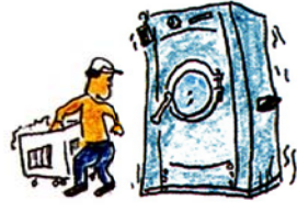
クリーニング店の 「洗濯機」「ドライ洗浄機」