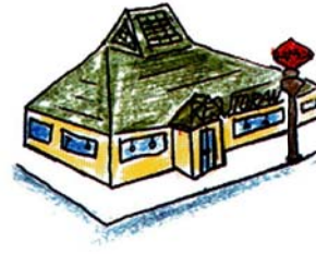
総床面積420㎡以上の「飲食店」

このほかにも写真店の「自動式フィルム現像機」や「電気めっき施設」等さまざまな施設があります。