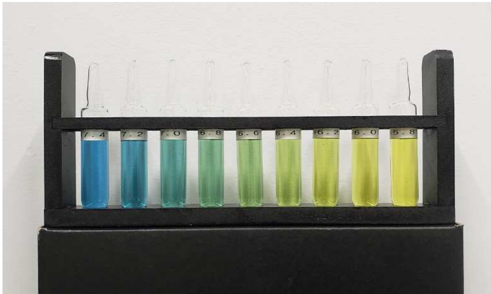
B T B 試薬 標準色