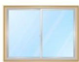
引き違い窓 ⇒2枚で1箇所