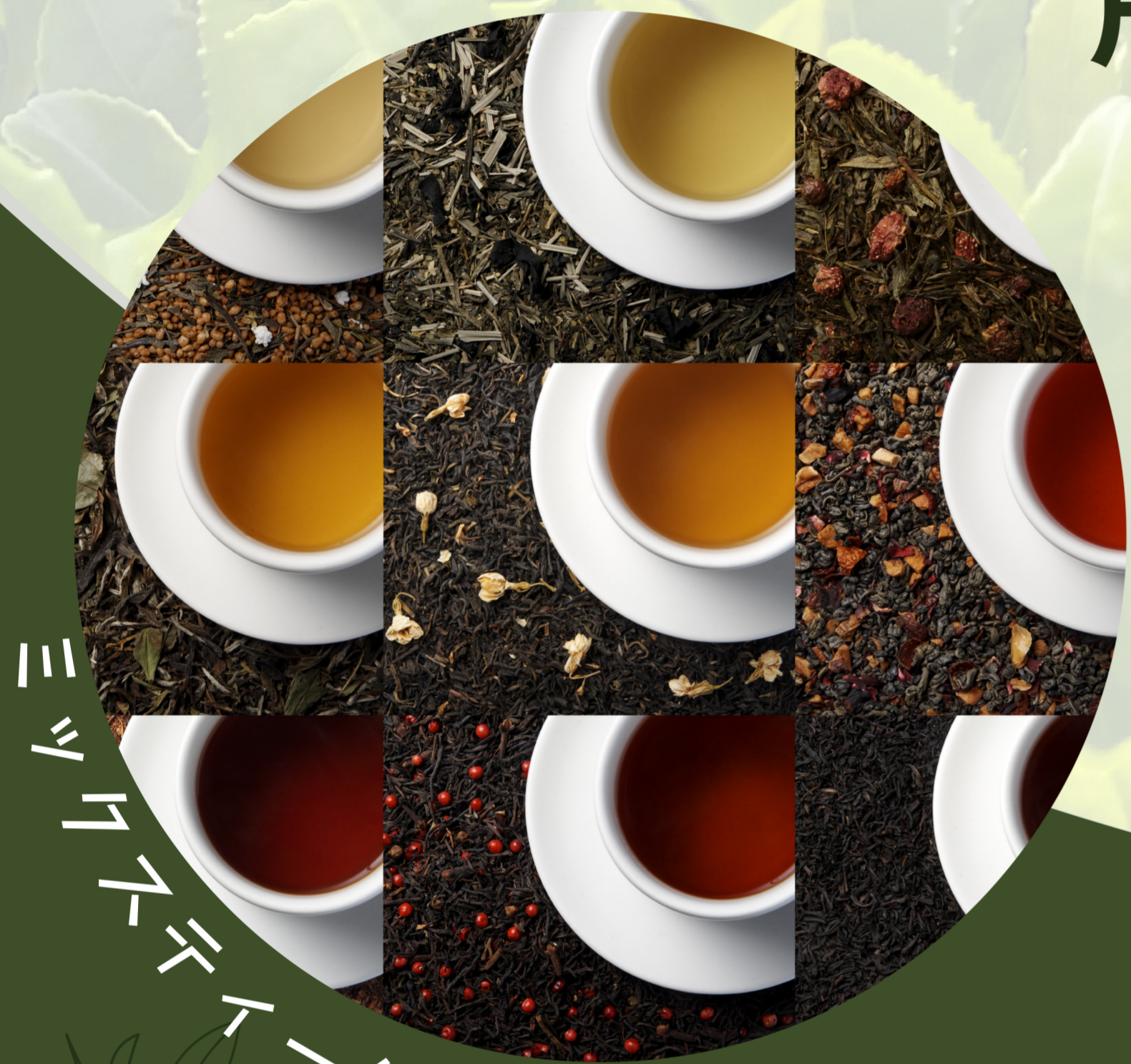
ミックスティー体験