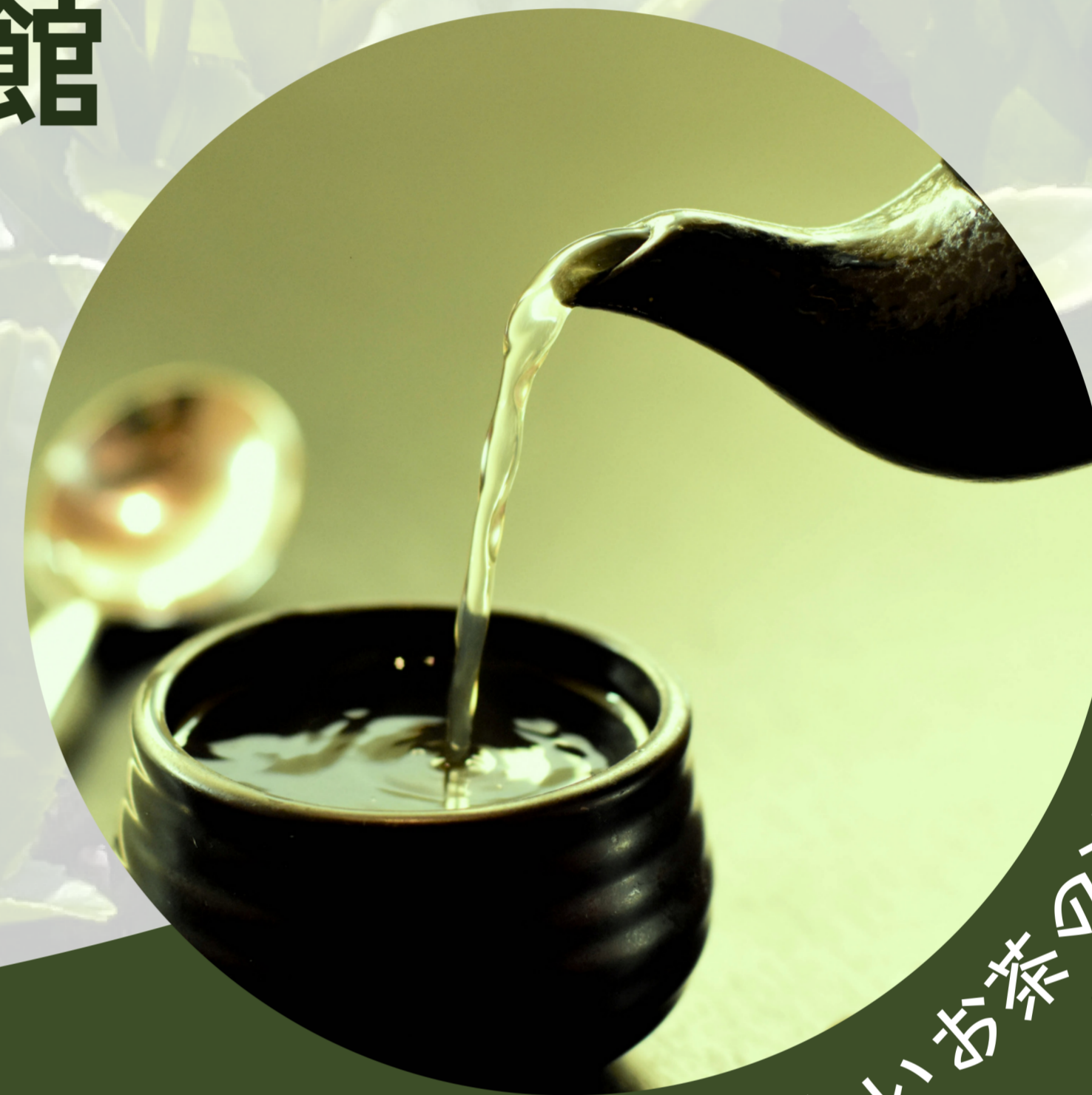
美味しいお茶の淹れ方教室