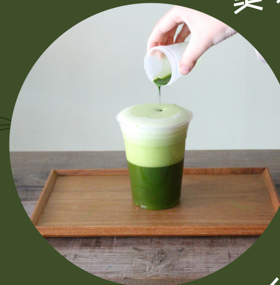
抹茶ミニシェイカー体験