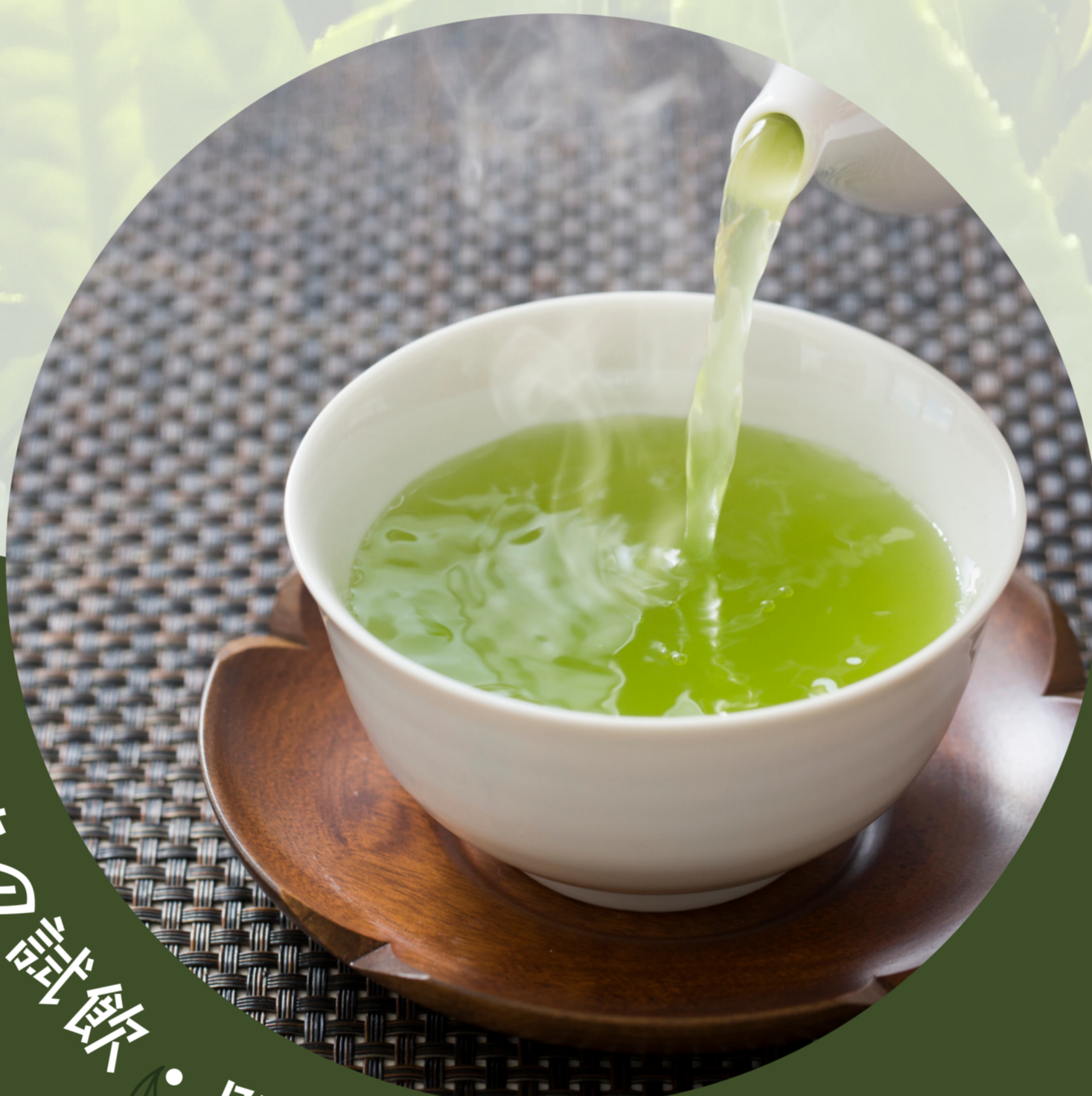
新茶の試飲・販売