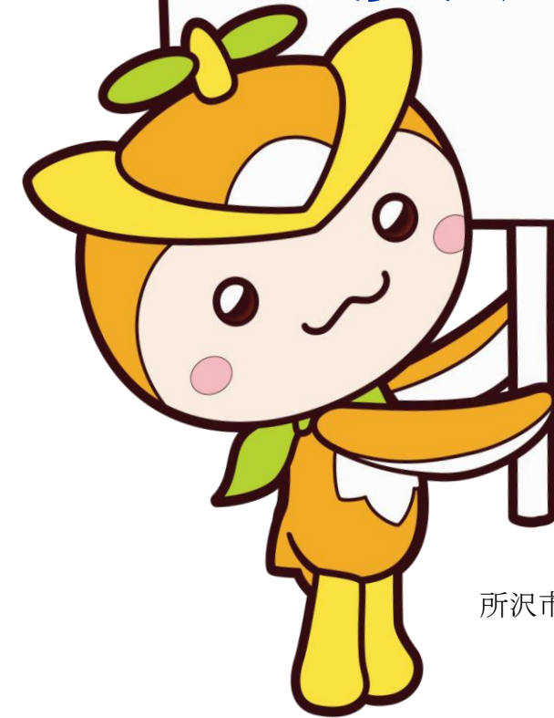
所沢市イメージマスコット トコロん