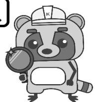
建設部マスコットキャラクタ「けんたぬ」