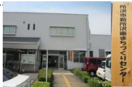
新所沢東まちづくりセンターの外観

休館日: 国民の祝日(土日の祝日は開館)・年末年始 業務時間: 各グループで異なります。