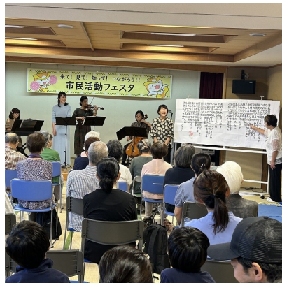
▲昨年の市民活動フェスタの様子

見つけられる場です。それぞれの団体が持つ悩みや現状も共有でき、心強い仲間ができるかもしれません。 月に1回程度開催します。登録団体のみ参加可能です。