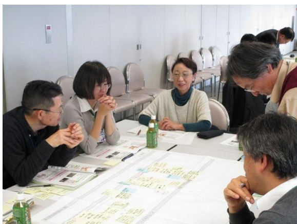
(当日の様子) 各班での検討