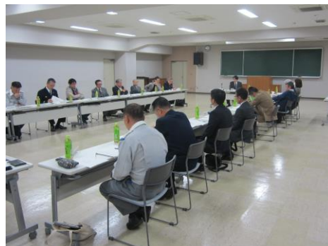
メディカルコントロール協議会

365日24時間体制での救急隊員に対する医師の指示・助言体制、救急隊員等の再教育の体制、救急活動の事後検証の体制、これら3つの体制を更に充実させ、救急活動における応急処置等の質の向上を図ります。