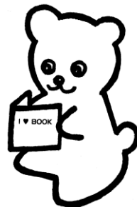
所沢図書館キャラクター「トベア」

■市民アンケート調査結果から、世代を問わず、多くの市民が、資料の充実を重要視し、新鮮で魅力ある蔵書を要望しています。あらゆる市民の多様な要望に応じられるような資料を収集するため、図書購入費の安定的かつ継続した予算措置と適正な蔵書管理が不可欠となります。また、資料の保存方法として、デジタル化と今後発展する新技術を取り入れた情報の提供方法を検討する必要があります。