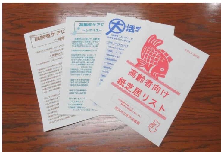
高齢者の読書に役立つ本リスト

※ 対面朗読奉仕者: 視覚障害などにより、文字(墨字)を読むことが困難な利用者を対象に、要望に応じて、館内の対面朗読室等で、対面で資料を代読する者。