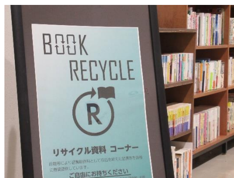
ブックリサイクル

新鮮で魅力ある蔵書構成を目指すとともに、役目を終えた図書等は、リサイクル本として公共施設や市民に提供することで資料の有効活用を図るなど、市民が本に親しめる環境づくりを継続的に行っていきます。