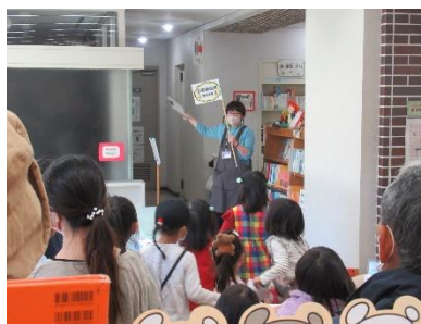
図書館まつり（図書館探検）

年齢層に応じた催し物・行事、各種講演会・講座の開催、市民ボランティアとの協働事業である図書館まつりなどを行い、図書館への興味や関心を喚起していきます。