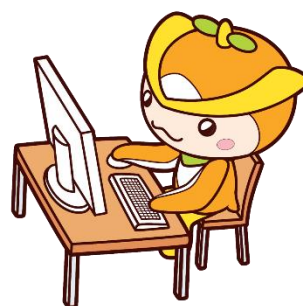
所沢市イメージマスコット「トコロん」

また、過去に調査回答した記録を継続的に集約したレファレンス事例のデータベースを拡充することにより、類似事例調査の効率化を図り、全館のレファレンスサービスの平準化と充実を目指します。