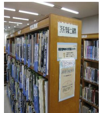
本館3階郷土資料コーナー

また、紙資料の劣化などによる情報の喪失を防ぐため、デジタルアーカイブ化等最適な方法で資料を保存していきます。