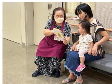
健康診査会場での読み聞かせ