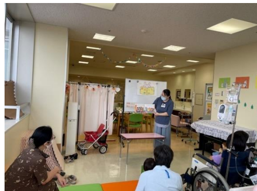
院内学級おはなし会