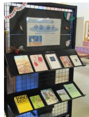
特集展示(中島京子)