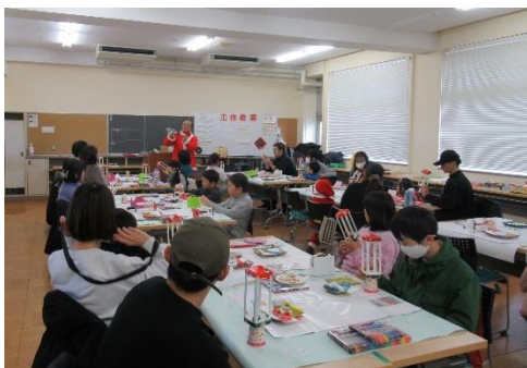
クリスマス工作教室

年齢に応じた「おはなし会」「かがくあそび」「工作教室」などの子ども向け行事を充実させ、子どもたちに絵本や昔話、知識の本などに親しむ機会を提供します。