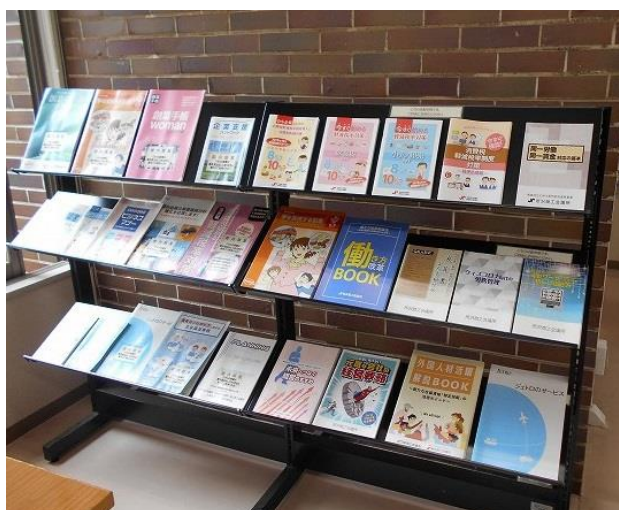
商工会議所パンフレット類

また、商工会議所、医師会等のほか、地域の商店街、自治会・町内会等の地域コミュニティとも連携し、資料の提供・情報交換や相互の事業広報を行うなど、図書館への理解と利用を促進するとともに、地域振興の一助となるよう取組を進めていきます。