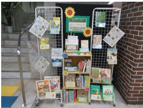
ブックリスト展示

特別支援学校、小・中学校等との連携・協力のもと、障害のある子ども、日本語を母語としない子ども、入院中の子どもなど、読書活動の困難な子どもへの支援を充実していきます。