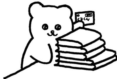
所沢図書館キャラクター「トベア」

※ 資料選定モニター：偏りのない幅広い図書館資料の収集を図るため、幅広く意見を取り入れることを目的に選出された学識経験者など。