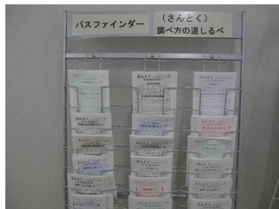
パスファインダー

また、調べ方案内である「パスファインダー」やテーマ別ブックリストの提供、データベースや図書館ホームページの各種レファレンスコンテンツの紹介など、市民が情報を迅速に入手するためのツールを充実し、利便性の向上を目指します。