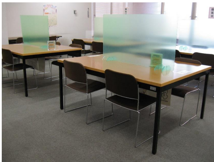
本館 3 階読書室

調べものや読書など静かな環境を求める声があるほか、子どもたちが家族と絵本を楽しむためのスペースやグループ学習に対応した席など、図書館を居場所として利用したいという要望を踏まえ、今後機会を捉えて、滞在しやすい空間の整備など、居心地のよさや快適性を向上させます。