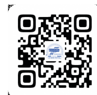
公式ホームページ