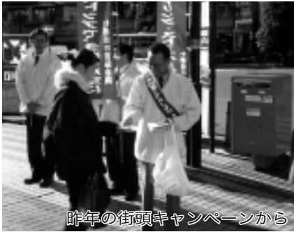
昨年の街頭キャンペーンから

市長を先頭に、環境推進員のご協力を得て、通行中の皆さんに地球温暖化の防止とともに、「ところバス」など、公共交通機関の利用の促進をPRします。